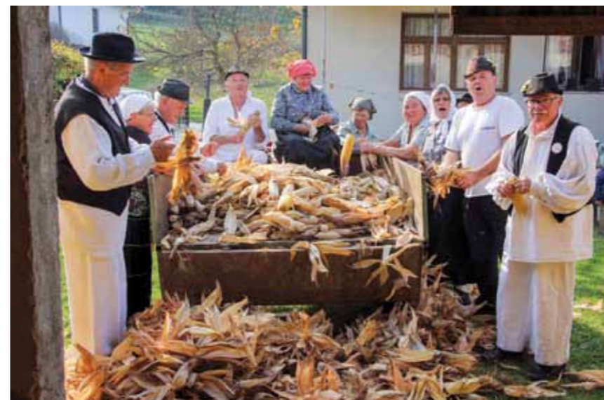
Komušanje kuruze štera je bila baš vrlo

čeljad pa se tako karuznih mustača i komušina našlo i na najneobičnijim mjestima.