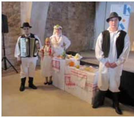
Ivanečki učenici sjajno su istražili ivanečku baštinu i predstavili je na Hvaru

♦♦ Za potrebe projekta u Prigorcu je snimljen i videouradak „Štief i Bara. Damača gašćonjska kamedija“ u izvođenju školske Dramske skupine