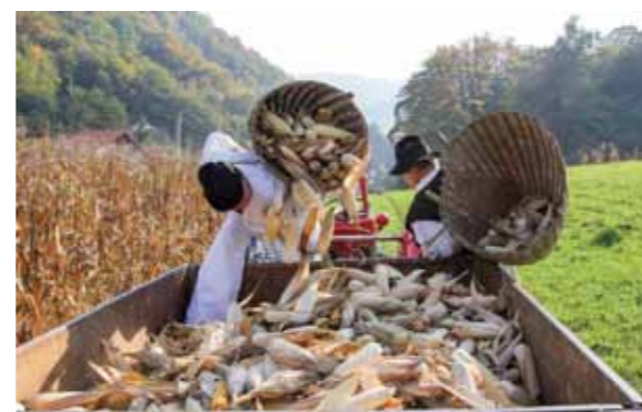
Članovi Maske u berbi kukuruza

svjetlo u lampašima, nakon čega bi se dečki i puce „pohvalali“ u komušinama. Običaj je to koji je izumiro zajedno s petrolejkama i seoskim okupljanjima na trebitvama, a koji su i ove godine oživjeli članovi Maske. Ukratko, dečki su u perušinj oborili žensku