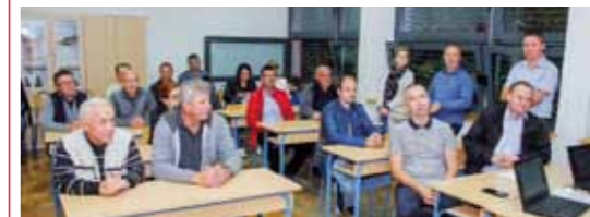
S osnivačke skupštine Šahovskog kluba Ivanec

POMOĆ U NEVOLJI Zadnja sjednica fundacije Pro vitae