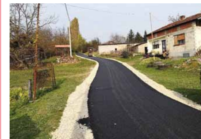
Asfaltiran je odvojak Kolari u MO-u Škriljevce

Ovogodišnjim programom ujedno je krenuo i srednjoročni program 2018. – 2022. godine kojim je predviđeno asfaltiranje ukupno 32 km ulica i cesta na cijelom gradskom području. (lir)