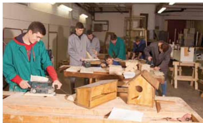
Poduzetnici su pozvani da iskoriste mogućnost korištenja dačkih stipendija

Stipendije za deficitarna zanimanja dodjeljuju se pod uvjetom da njihovi korisnici nakon završetka studija, ako postoji potreba, ostanu raditi na području grada Ivanca najmanje onoliko vremena koliko su dobivali stipendiju, na što će se studenti obvezati ugovorom. (lir)