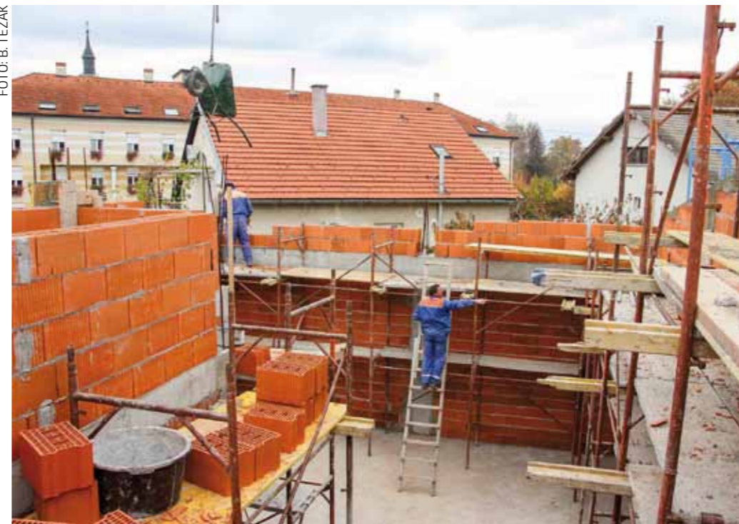
Zadnja faza građevinskih radova na muzejskom zdanju

Ovogodišnji radovi znače nov korak u realizaciji ovog smjelog projekta koji će u konačnici uvrstiti naš grad na kartu hrvatskih gradova sa smart (pametnim) muzejima i koji će Ivanec afirmirati kao destinaciju koja će posjetiteljima ponuditi doživljaj planinarstva na dosad neviđen način. (lir)