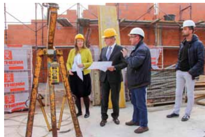
U obilasku gradilišta s projektantima i izvođačima radova

– Ovo su zadnji građevinski radovi na muzejskom objektu. Poznato je da se muzej gradi fazno. U prvoj fazi izgrađen je dio objekta koji će u budućnosti biti u funkciji ulaza, suvenirnice i pratećih prostora, a sada se gradi dio namijenjen muzejskom izložbenom